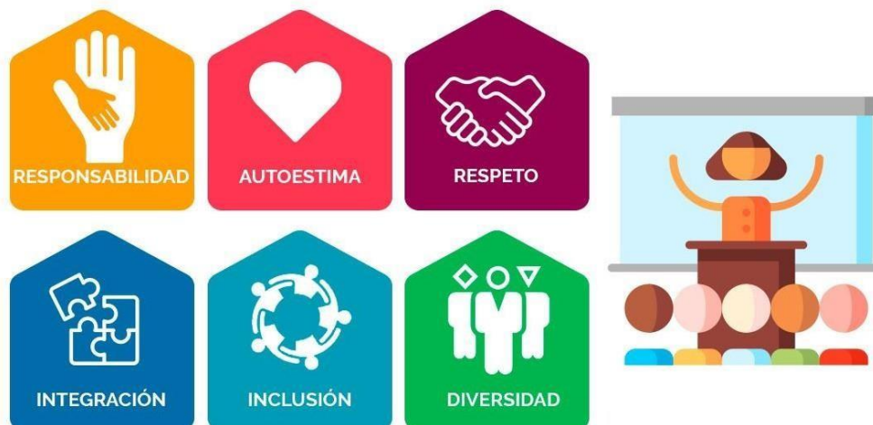
Figura 1: Principio y Valores educacionales formativos.